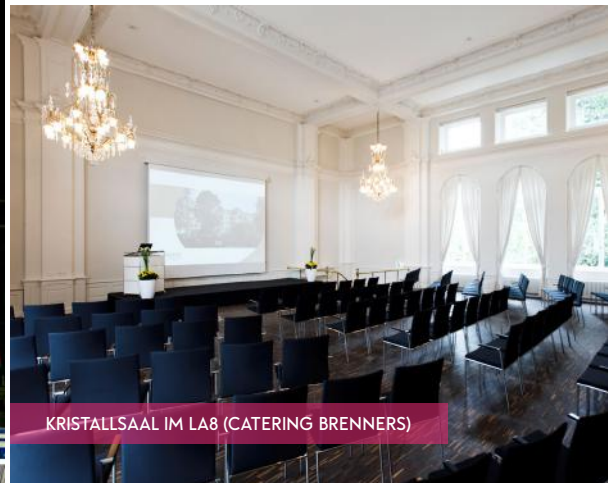
KRISTALLSAAL IM LA8 (CATERING BRENNERS)