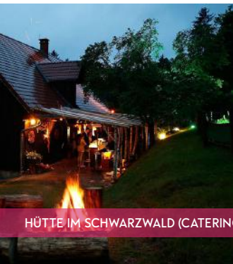
HÜTTE IM SCHWARZWALD (CATERING BRENNERS)