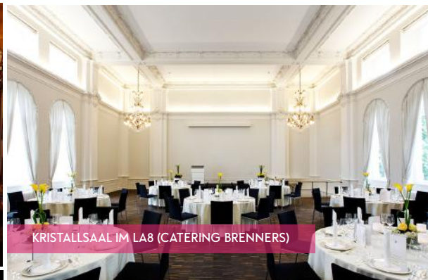
KRISTALLSAAL IM LA8 (CATERING BRENNERS)