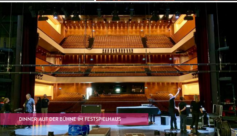
DINNER AUF DER BÜHNE IM FESTSPIELHAUS